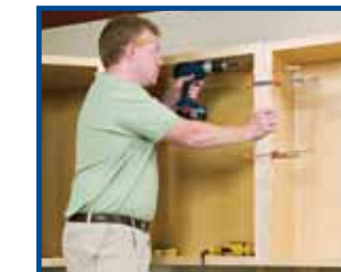
3. Screw cabinet frames together