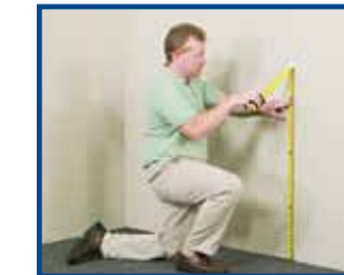
1. Mark walls