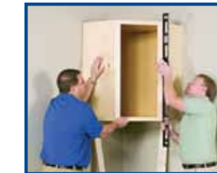
2. Install corner wall cabinet