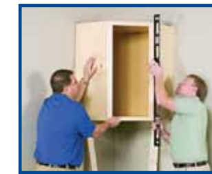
2. Instale el gabinete de pared para esquina