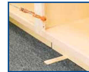
6. Nivele y acuríe de ser necesario