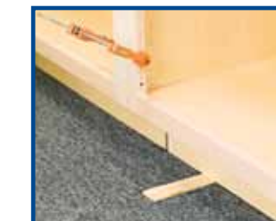
6. Level and shim if needed