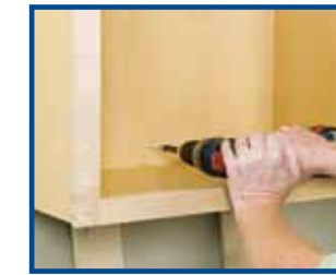
4. Atornille la parte posterior de los gabinetes a las paredes