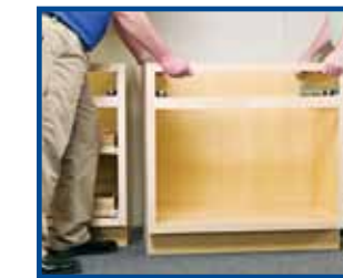
5. Pro siga con los gabinetes base