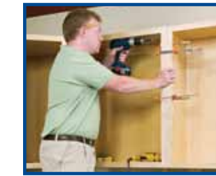
3. Junte los marcos de los gabinetes mediante tornillos