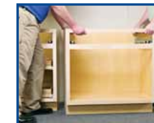
5. Proceed to base cabinets