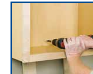
4. Screw cabinet backs to walls